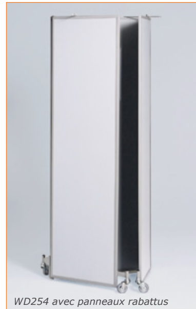
WD254 avec panneaux rabattus